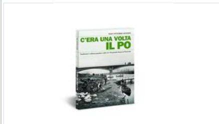
C'era Una Volta Il Po