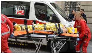
07/10/2015 Accoltella medico e infermiere per sfuggire a un "Tso": arrestato per tentato omicidio MASSIMILIANO PEGGIO, NOEMI PENNA