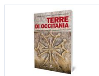
Terre Di Occitania