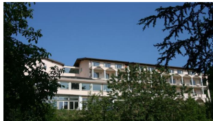
07/07/2015 Ameno, migranti tuttofare in cambio del pasto