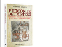
Piemonte Del Mistero