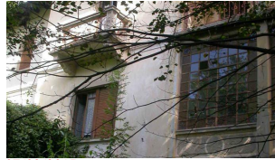
07/02/2015 Venduta la villa di Ameno: il comune di Novara incassa 555 mila euro