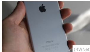
07/10/2015 Rivelato! Questo trucco sta facendo risparmiare una fortuna in Italia