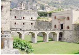
08/08/2015 Cresce l'attesa per "Fortissimo" a Vinadio