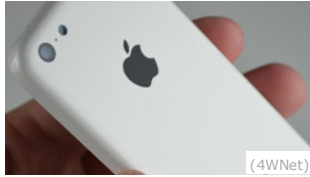
07/10/2015 Rivelato! Questo trucco sta facendo risparmiare una fortuna in Italia